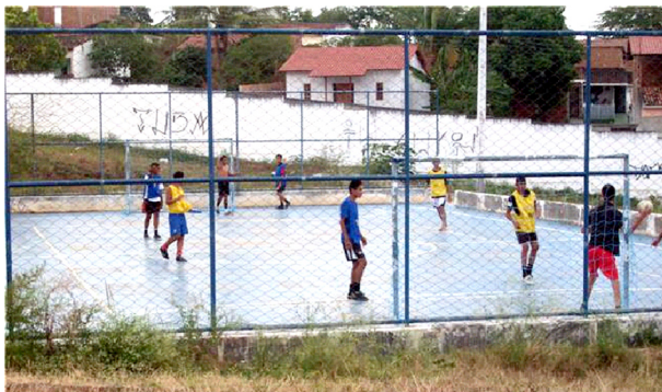
Imagem 04: Quadra da SAB Santa Rosa: regras específicas de utilização

Agora, os sócios têm preferência né? Se uma pessoa que é sócio precisa da SAB, e uma pessoa que não é sócio precisa também, o sócio tem preferência, porque aqui é mais pelo sócio (Presidente da SAB Santa Rosa).